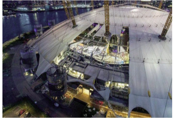
Một phần mái của nhà thi đấu O2 Arena bị thổi bay do bão Eunice

BĐKH xảy ra, các hành động, giải pháp hiện nay chỉ với mong muốn giảm thiểu tác động của BĐKH đối với con người. Cần hành động ngay bây giờ để cải thiện quy định về địa điểm và cách thức xây dựng tài sản, khuyến khích sử dụng vật liệu chống chịu và xem xét các giải pháp sáng tạo và tự nhiên để ứng phó BĐKH.