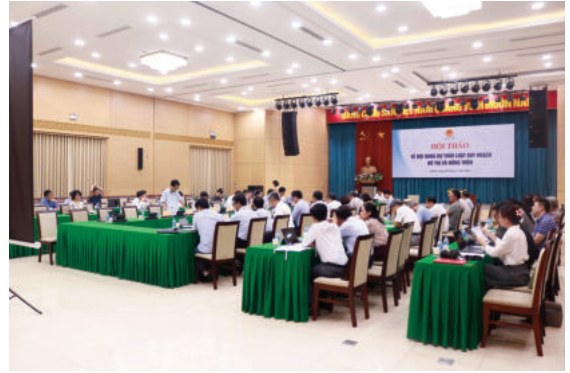
Quang cảnh hội thảo

trình tổ chức triển khai thực hiện các quy định pháp luật thời gian qua đã phát sinh một số vấn đề cần phải được nghiên cứu, sửa đổi, bổ sung, hoàn thiện.