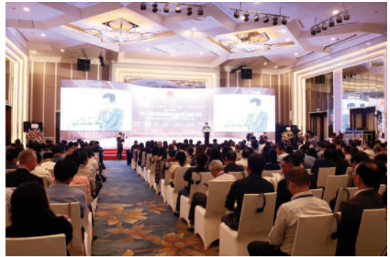
Toàn cảnh Diễn đàn

Bộ trưởng Nguyễn Thanh Nghị tin tưởng Diễn đàn đô thị Việt Nam 2023 là cơ hội để các chính quyền đô thị, nhà quản lý, chuyên gia, tổ chức, cộng đồng có liên quan đối thoại, chia sẻ, kết nối các tri thức, bài học, thực tiễn quan trọng để cùng có những đề xuất, định hướng, cách làm hay, nhằm hiện thực hóa những