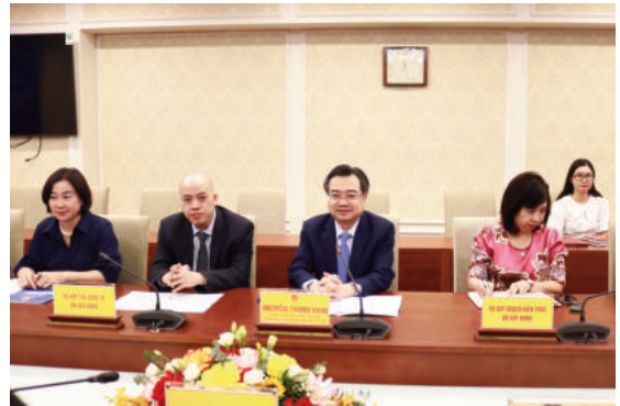
Bộ trưởng Nguyễn Thanh Nghị phát biểu tại buổi lễ

Tại Lễ ký kết, Bộ trưởng Nguyễn Thanh Nghị và Bộ trưởng Han WhaJin cùng ghi nhận, biểu dương tinh thần làm việc nghiêm túc của các