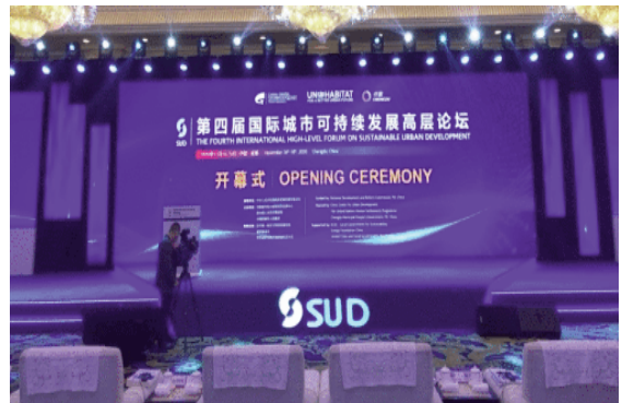
Diễn đàn phát triển đô thị chất lượng cao toàn quốc lần thứ 4 tổ chức tại Thượng Hải

Thúc đẩy chuyển đổi và nâng cấp ngành xây dựng, cung cấp các sản phẩm xây dựng