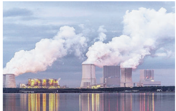
Năng lượng hóa thạch hiện đang chiếm hơn 80% tổng mức tiêu thụ năng lượng toàn cầu

Theo thông cáo báo chí của hội đồng thành phố Boston, việc sử dụng nhiên liệu hóa thạch trong các tòa nhà chiếm hơn 1/3 lượng khí thải nhà kính của thành phố. Điều này không chỉ góp phần gây ra biến đổi khí hậu toàn cầu mà còn gây ô nhiễm không khí tại địa phương, ảnh hưởng nặng nề đến các tầng lớp dân nghèo, ít được bảo đảm xã hội. Theo nhiều nghiên cứu, nhà ở chuyển sang không sử dụng nhiên liệu hóa thạch sẽ đem lại những lợi ích về lâu dài như chất lượng không khí được cải thiện, giảm phát thải carbon, nâng cao mức tiện nghi nhiệt.