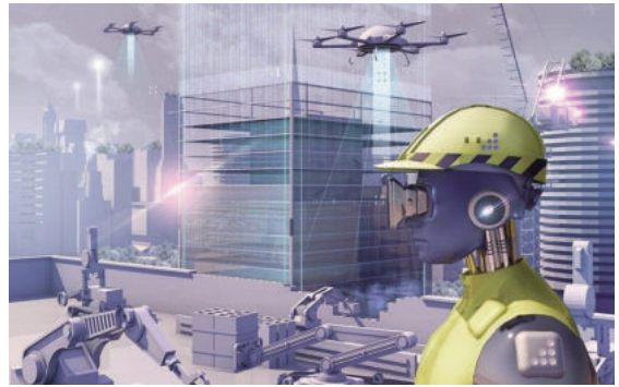
Trí tuệ nhân tạo trong xây dựng thông minh

sử dụng tài nguyên của họ, chẳng hạn như vật liệu và lao động, bằng cách xác định các khu vực có thể giảm chất thải hoặc nơi có thể sử dụng tài nguyên hiệu quả hơn.