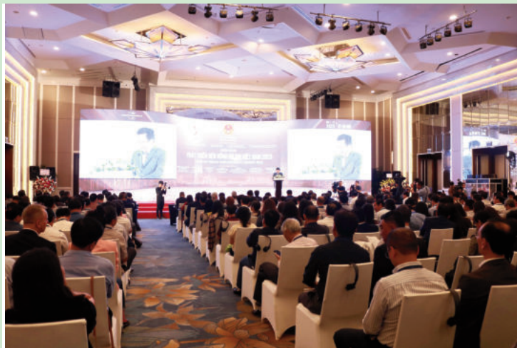
Toàn cảnh Diễn đàn