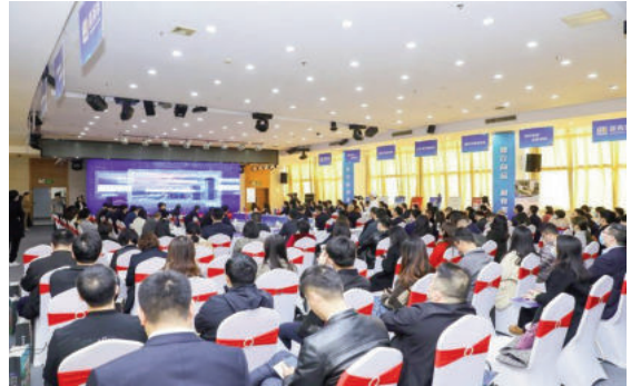
Hội nghị đào tạo về việc áp dụng nền tảng Yongyoujia cho các chuyên gia, lãnh đạo công tác xây dựng và các đơn vị cơ quan, doanh nghiệp quản lý tài chính tại Nam Ninh

Mới đây, Cục Nhà ở và Phát triển đô thị - nông thôn thành phố Nam Ninh đã triển khai dịch vụ trực tuyến giám sát quỹ cho các giao dịch nhà ở mua lại, bộ phận giám sát của các cơ quan quản lý và ngân hàng sẽ đóng vai trò là bên thứ 3, thực hiện trách nhiệm thiết lập các tài khoản theo quy định dựa trên ứng dụng giữa bên mua và bên bán, đồng thời thực hiện nhiệm vụ giám sát các khoản giao dịch nhà ở, bao gồm tiền đặt cọc, khoản thanh toán trước, khoản thanh toán lần cuối, và một số khoản chi phí khác...trong quá trình giao dịch nhà ở mua lại, cũng như khoản hoa hồng của các doanh nghiệp, công ty môi giới bất động sản; sau khi