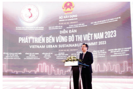
Bộ trưởng Nguyễn Thanh Nghị phát biểu khai mạc Diễn đàn

Ngày Đô thị Việt Nam 8/11 năm nay càng có ý nghĩa hơn khi diễn ra đúng vào dịp kỷ niệm 20 năm hình thành và phát triển của Diễn đàn Đô thị Việt Nam. Qua 20 năm, Diễn đàn đã thúc