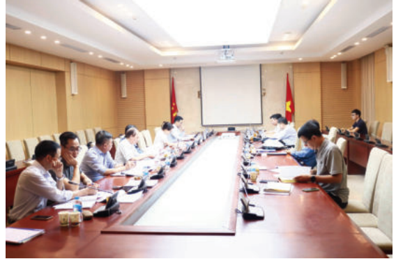
Toàn cảnh cuộc họp

Tại cuộc họp, các chuyên gia phản biện và thành viên Hội đồng nhất trí với lý do, sự cần thiết thực hiện Nhiệm vụ, đồng thời ghi nhận nỗ lực của nhóm nghiên cứu trong quá trình thực hiện các nội dung, yêu cầu theo đề cương