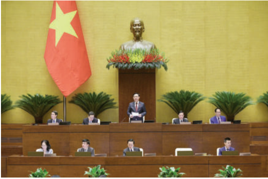
Chủ tịch Quốc hội Vương Đình Huệ điều hành Phiên chất vấn sáng ngày 7/11