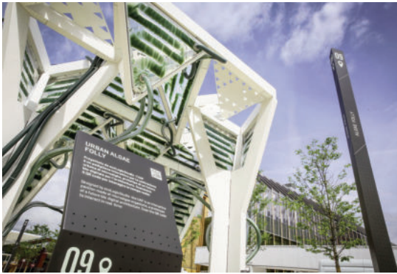
Gian trưng bày Urban Algae Folly tại EXPO 2015 Milan có lớp vỏ EFTE với tảo