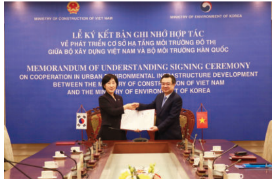
Bộ trưởng Nguyễn Thanh Nghị và Bộ trưởng Han WhaJin cùng ký kết Bản ghi nhớ hợp tác giữa Bộ Xây dựng Việt Nam và Bộ Môi trường Hàn Quốc

Trên cơ sở kết quả hợp tác trong thời gian qua và tiềm năng, nhu cầu hợp tác trong thời gian tới, Bộ Xây dựng mong muốn 2 bên tập trung vào những nội dung hợp tác về xây dựng