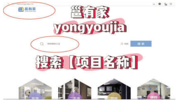
Cấu trúc dịch vụ của Nền tảng Yongyoujia

Sau khi dịch vụ giám sát quỹ giao dịch nhà ở mua lại được ra đời tại Nam Ninh, các giao