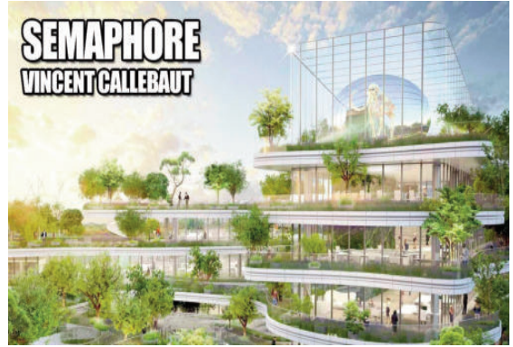
Dự án Semaphore của V.Callebaut

sự kết hợp như vậy là khác nhau, tùy theo mỗi công ty thiết kế hoặc nhà nghiên cứu cụ thể.