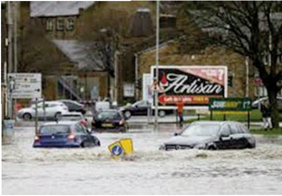
Một trận ngập lớn làm tê liệt giao thông ở Anh