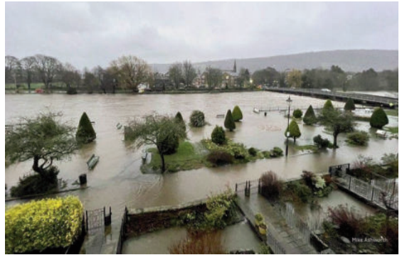
Bão Franklin đã khiến cho nhiều khu vực ở Bắc Ai-len ngập trong biển nước do sông tràn bờ

thoát nước đô thị bền vững vì các bề mặt không thấm nước như lát nhựa đường chỉ càng làm tăng nguy cơ ngập lụt. Những hệ thống thoát nước bền vững bao gồm: