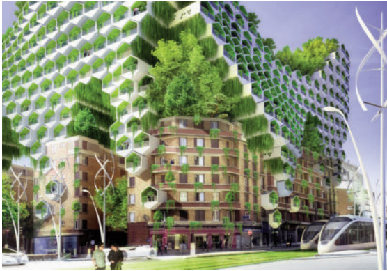
Một tòa nhà trong dự án đề xuất Paris Smart City 2050 của V. Callebaut