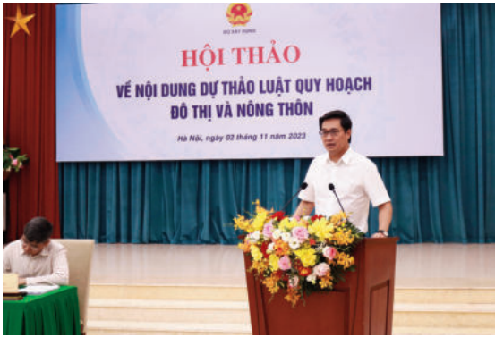
Thủ tướng Nguyễn Xuân Phúc phát biểu tại hội thảo