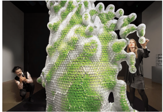
Dự án vật liệu sống HORTUS XL của ecoLogicStudio

Ở khía cạnh quy hoạch, tổ hợp kết nối không gian mặt nước và không gian công cộng của Port du Rhin và các khu dân cư lân cận, không chỉ trở thành không gian làm việc của công ty mà còn là nơi nghỉ ngơi thư giãn cho người dân và du khách của thành phố.