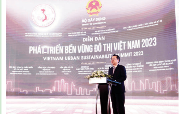
Bộ trưởng Nguyễn Thanh Nghị phát biểu khai mạc Diễn đàn