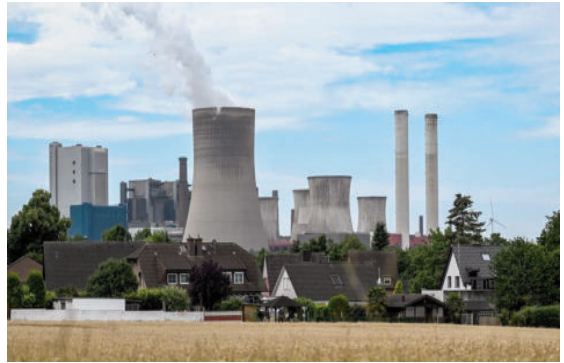
Một nhà máy nhiệt điện than ở miền Tây nước Đức

Thị trưởng Chicago - ông Lori Lightfoot tuyên bố đến năm 2025, tất cả các tòa nhà và ông trình trong thành phố sẽ vận hành hoàn toàn bằng năng lượng sạch, tái tạo. Chicago hiện là một trong những thành phố lớn nhất tại Mỹ đã thực hiện cắt giảm thành công lượng phát thải carbon của thành phố, và đang bắt tay vào quá trình chuyển đổi các phương tiện vận chuyển (ô tô, xe buýt) sang sử dụng điện hoàn toàn vào năm 2035. Theo ngài Thị trưởng, thành phố có kế hoạch "thúc đẩy tác động cao tới khí hậu, hình thành lực lượng lao động trong