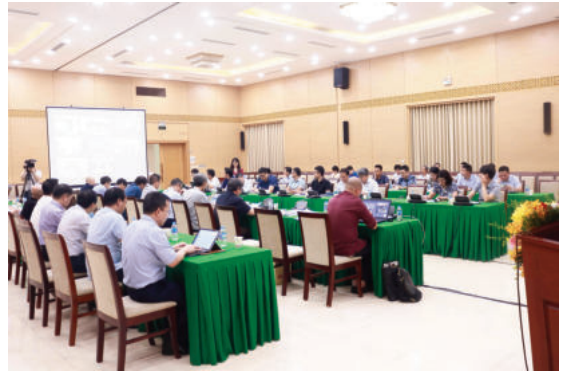
Toàn cảnh hội thảo tại điểm cầu Bộ Xây dựng

Về cơ bản, các đại biểu thống nhất với cấu trúc các dự thảo tiêu chuẩn. Tuy nhiên, nhằm đảm bảo chất lượng tối ưu cho các dự thảo, nhiều đại biểu nhấn mạnh sự cần thiết thống nhất thuật ngữ trong dự thảo tiêu chuẩn với các thuật ngữ, khái niệm liên quan trong các văn bản pháp luật hiện hành; làm rõ hơn thuật ngữ