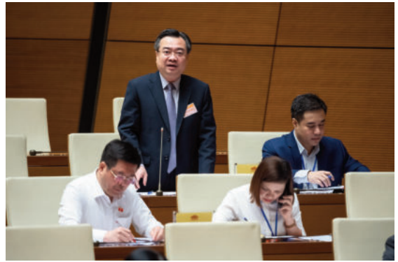
Bộ trưởng Nguyễn Thanh Nghị trả lời chất vấn của đại biểu Quốc hội

hành động về quy hoạch, xây dựng, quản lý, phát triển bền vững đô thị Việt Nam; (2) Nâng cao chất lượng quy hoạch, quản lý quy hoạch, đáp ứng yêu cầu xây dựng, quản lý đô thị bền vững; (3) Đầu tư phát triển hệ thống hạ tầng đô thị đồng bộ, hiện đại, liên kết, thích ứng với biến đổi khí hậu; (4) Thực hiện các nhiệm vụ, đề án chuyên ngành; (5) Xây dựng cơ chế chính sách, văn bản quy phạm pháp luật.